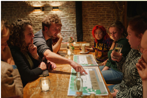
Afbeelding: Stichting 1828

panels worden begeleid door community managers van 1828. Actieve deelnemers krijgen, binnen de geldende kaders, voorrang bij toewijzing van een woning. De 1828-woonpanels zijn opgericht door projectontwikkelaar Wibaut.