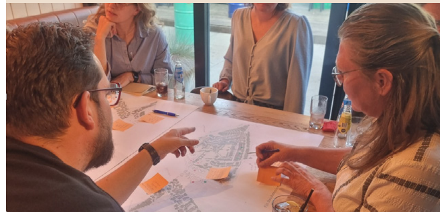
Afbeelding: Braining the Future

Plantteams brengen omwonenden, woningzoekenden en lokale experts samen in één proces van planvorming tot uitvoering van een nieuwbouwproject. Deelnemers leren elkaars positie, zorgen en belangen kennen, waardoor ontwerpkeuzes beter worden afgewogen en discussies over schurende belangen beter verlopen. Het langdurig betrekken van woningzoekenden blijft een uitdaging, omdat de doorlooptijd lang is en hun direct belang vaak beperkt. Heldere kaders, zoals duidelijke afspraken over rollen, gespreksonderwerpen, werkgroepen en wat wel of niet binnen de invloedssfeer ligt, helpen om verwachtingen te sturen. Hierdoor blijft het voor alle deelnemers duidelijk waar ze over meepraten en hoe hun bijdrage wordt benut, wat het draagvlak versterkt. De plantteams worden georganiseerd door Braining the Future in samenwerking met Synchroon en de gemeente Tilburg.