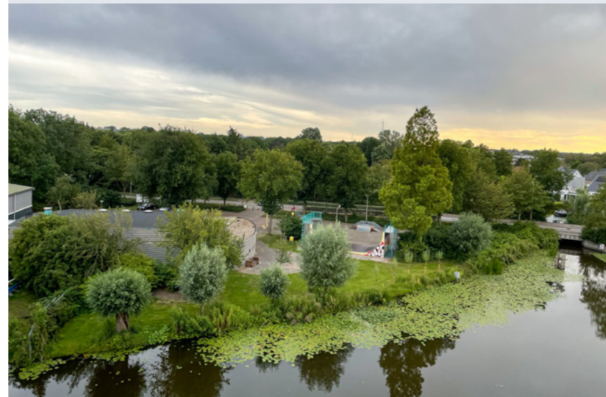
Afbeelding: Gemeente Lisse

In Lisse is een kleine groep woningzoekenden voor starterswoningen ingezet om weerstand onder omwonenden te doorbreken. Hun persoonlijke verhalen tijdens een inspraakbijeenkomst – georganiseerd door de gemeente en een lokale welzijnsorganisatie – bleken voldoende om het debat te verbreden en meer begrip te creëren. Het voorbeeld in Lisse laat zien dat timing cruciaal is. Woningzoekenden te vroeg inbrengen kan averechts werken als omwonenden zich nog niet gehoord voelen in de nieuwbouwplannen. Woningzoekenden te laat betrekken zorgt ervoor dat omwonenden niet inzien waarom een dergelijk project er komt en vooral veel bezwaren zien.