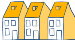
Meer en betaalbare woningen