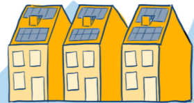
Circulair en duurzaam bouwen